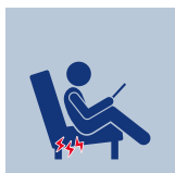
používanie nízkych mäkkých sedadiel